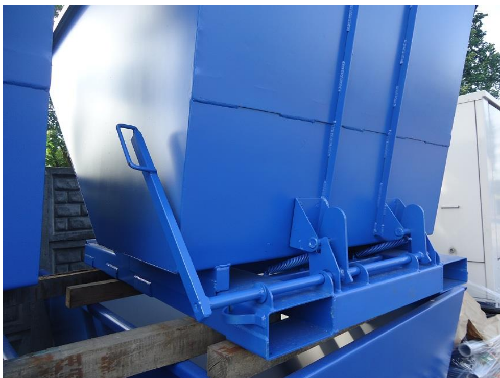
Tył kontenera o poj. 1,3-1,6m 3