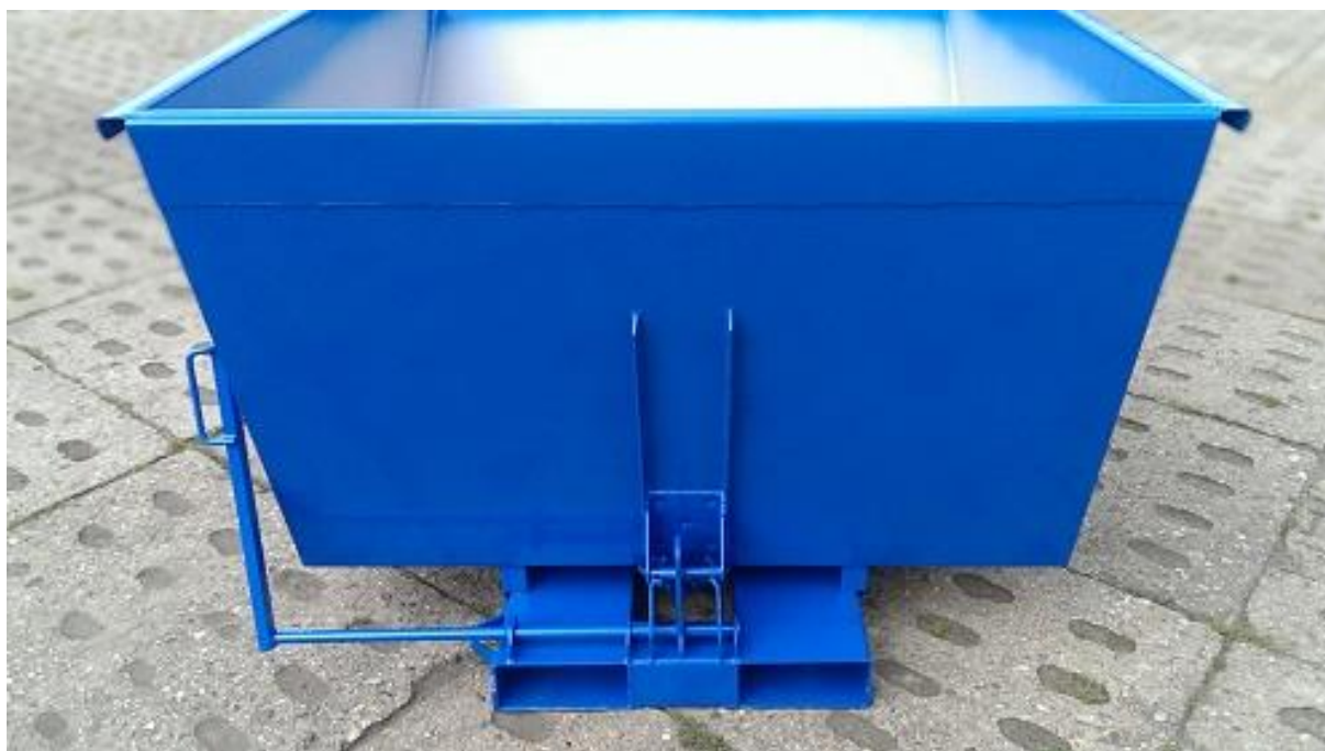
Tył kontenera o poj. 0,5 - 1,0m 3

58-200 Dzierżoniów ul. Wrocławska 6/5 e-mail: artebiuro@artesystem.pl tel/fax: 74 831 14 75