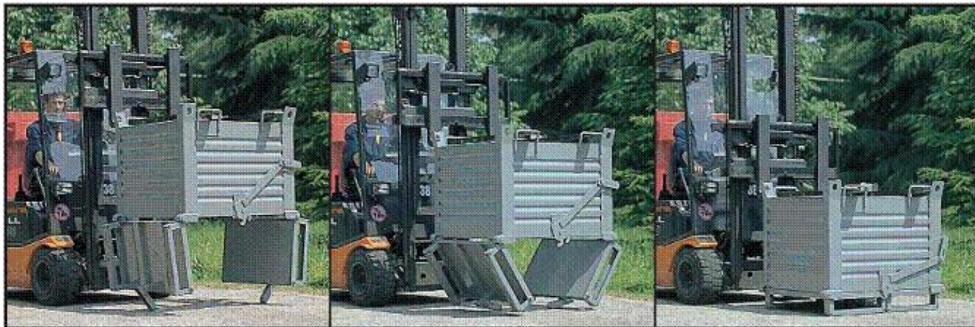
1. Podstawa otwarta całkowicie