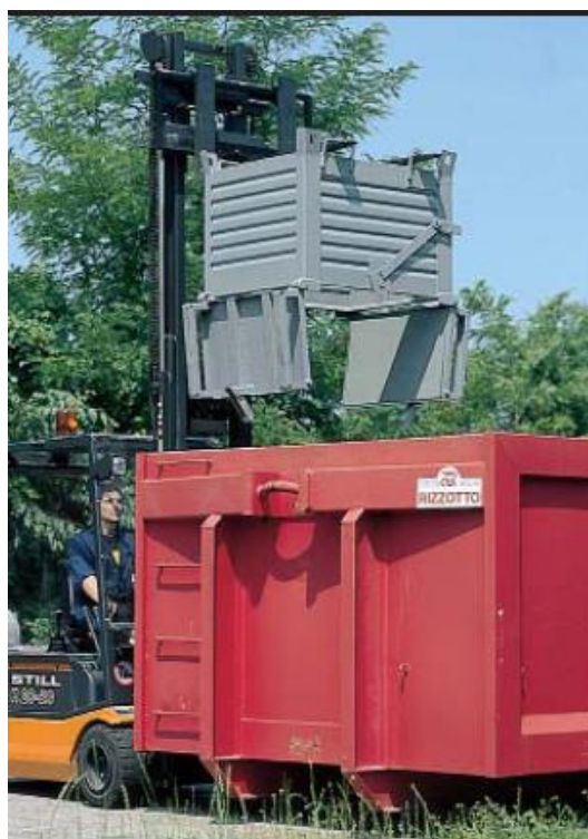
3. Podstawa całkowicie zamknięta