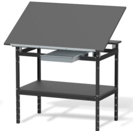
Stół warsztatowy HSS 06 z pochylanym blatem, szufladą i półką