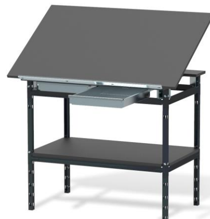
Stół warsztatowy HSS 06 z pochylanym blatem, szufladami i półką