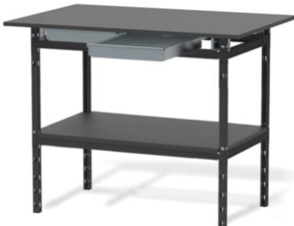
Stół warsztatowy HSS 06 z szufladami i półką