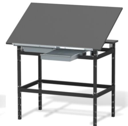
Stół warsztatowy HSS 06 z pochylanym blatem i szufladami