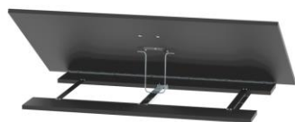
nr kat. 2-06-61 Zespół pochylanego blatu do stołu HSS 06