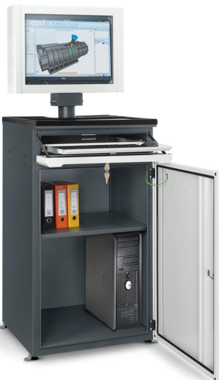
Wnętrze szafy na komputer HSC 02