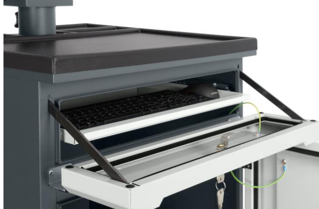
Otwarta szuflada pod klawiaturę i mysz