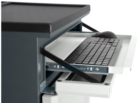
Wysunięta szuflada pod klawiaturę i mysz