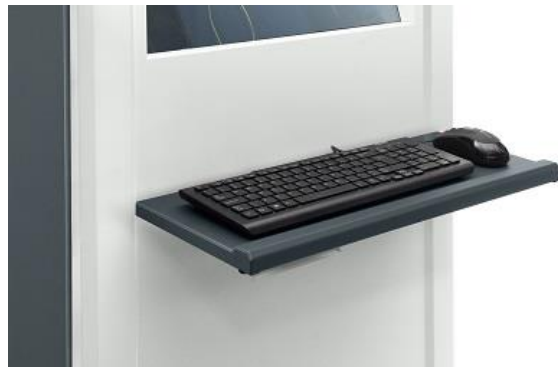
Rozłożona szuflada pod klawiaturę i mysz