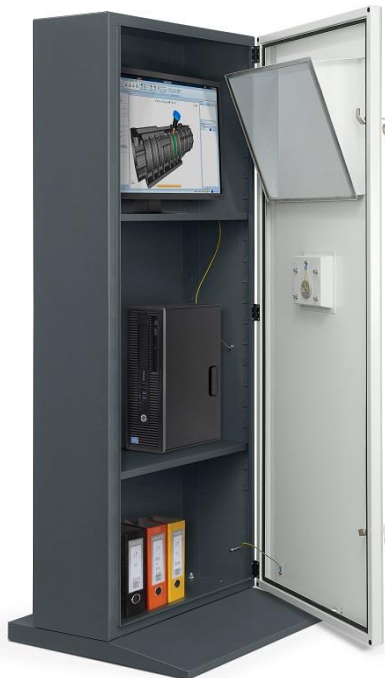
Wnętrze szafy na komputer HSC 03