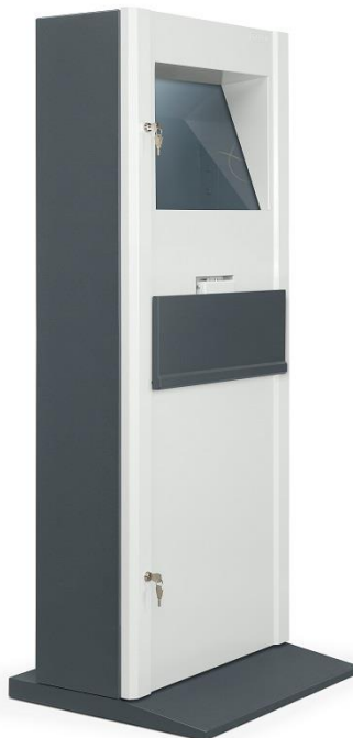
Szafa ze złożoną półką