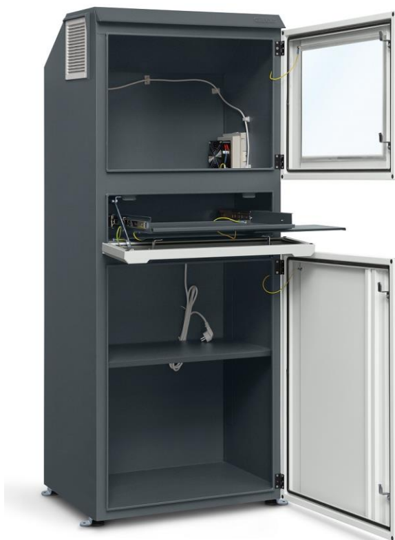
Wnętrze szafy na komputer HSC 06