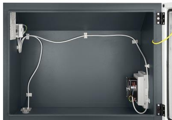
Wnętrze komory górnej