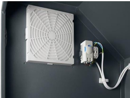
Widok filtra przeciwpyłowego od wewnątrz

58-200 Dzierżoniów ul. Wrocławska 6/5 e-mail: artebiuro@artesystem.pl tel/fax: 74 831 14 75