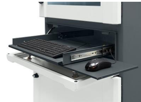
Wysunięta szuflada pod klawiaturę i mysz