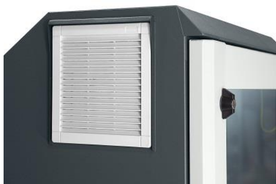
Widok filtra przeciwpyłowego od zewnątrz