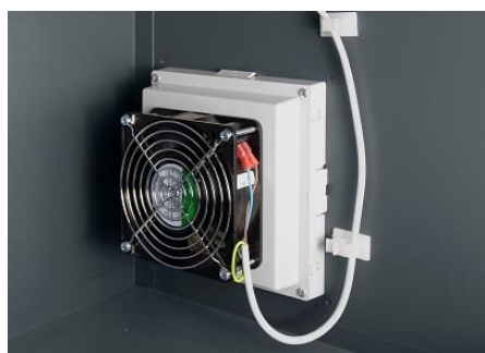
Widok wentylatora od wewnątrz