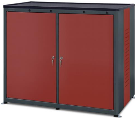
nr kat. 2-22-71

58-200 Dzierżoniów ul. Wrocławska 6/5 e-mail: artebiuro@artesystem.pl tel/fax: 74 831 14 75