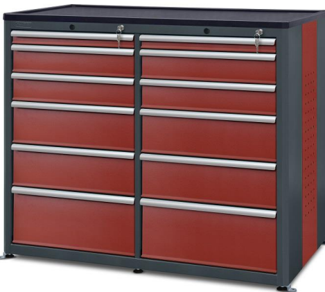
nr kat. 2-22-75