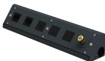
nr kat. 2-20-92 Listwa do dystrybucji zasilania i sprężonego powietrza wyposażona w 6 otworów do zamontowania gniazd zasilania elektrycznego, ładowarki USB, doprowadzenia sprężonego powietrza (do wyboru)