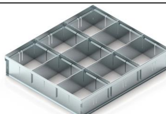
nr kat. 2-06-71 Podziałka do szuflad o wys. 120, 180, 240 mm Wym. 528 x 100 x 458 mm