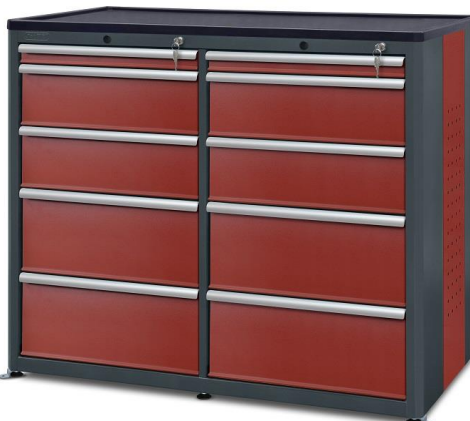
nr kat. 2-22-76