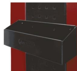
nr kat. 2-16-24 Pojemnik na akcesoria Wym. 305 x 100 x 86 mm