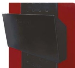
nr kat. 2-16-23 Kieszonka na dokumenty Wym. 305 x 180 x 80 mm