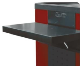
nr kat. 2-16-22 Półka składana Wym. 400 x 120 x 255 mm