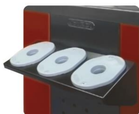
nr kat. 2-16-20 Półka z gniazdami ISO ( ISO/BT/SK 30, ISO/BT/SK 40, ISO/BT/SK 50 )