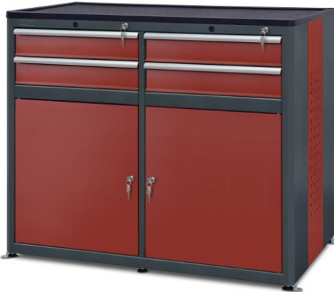
nr kat. 2-22-73