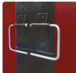
nr kat. 2-16-21 Wieszak do ręczników papierowych