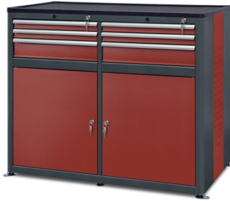
nr kat. 2-22-74