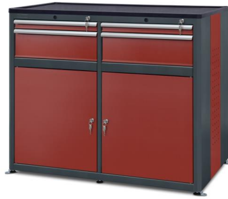
nr kat. 2-22-72