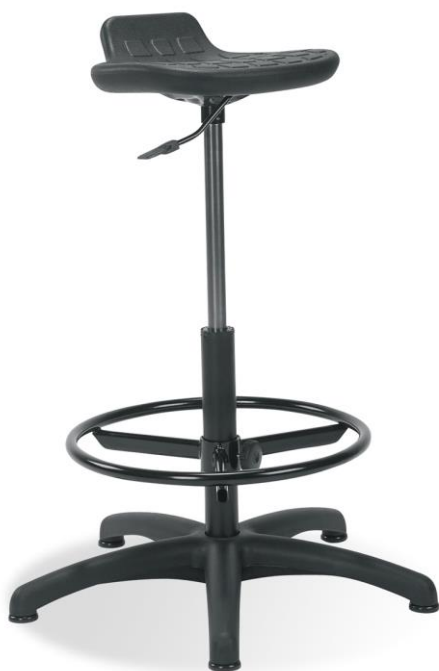
Taboret warsztatowy WORKER ring base

Poglądowe zdjęcia taboretu specjalistycznego