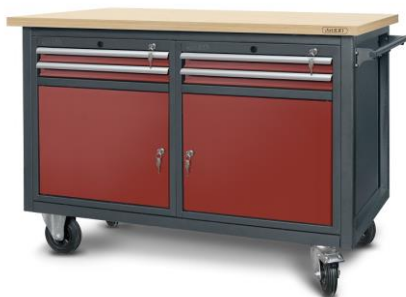
nr kat. 2-23-06