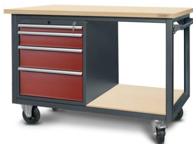
nr kat. 2-23-05