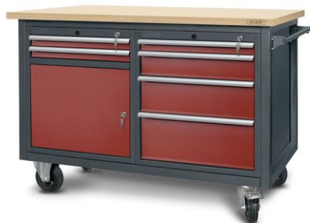
nr kat. 2-23-09