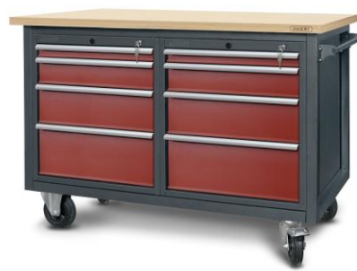
nr kat. 2-23-15