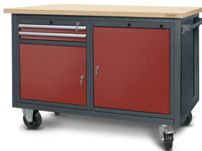
nr kat. 2-23-07