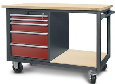
nr kat. 2-23-04