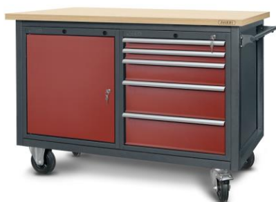
nr kat. 2-23-11

58-200 Dzierżoniów ul. Wrocławska 6/5 e-mail: artebiuro@artesystem.pl tel/fax: 74 831 14 75