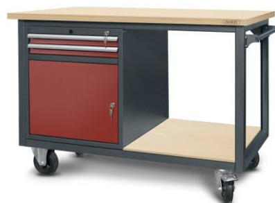
nr kat. 2-23-02