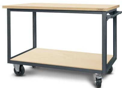
nr kat. 2-23-01

58-200 Dzierżoniów ul. Wrocławska 6/5 e-mail: artebiuro@artesystem.pl tel/fax: 74 831 14 75