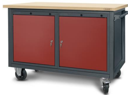
nr kat. 2-23-10