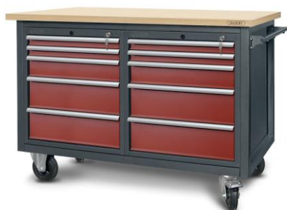
nr kat. 2-23-13